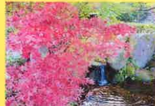
深流の散歩道：ヤマモミジ