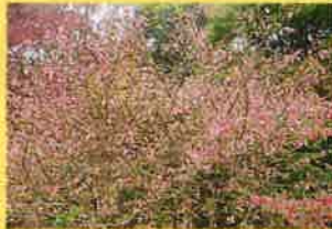
第一駐車場：ニシキギ