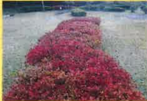
G.G場：ドウダンツツジ