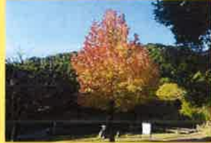
親水池：アメリカフウ