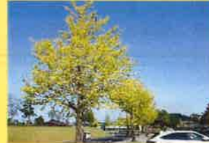
車道沿い：イチヨウ