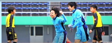
決勝戦：バディーSC × 柏レイソル

● 鹿児島県代表のFCトリンプルは、1次ラウンドを1位で通過、決勝ラウンドに進み、初戦で優勝チームのバディーSCと対戦して、善戦しましたが、0-2で敗れました。